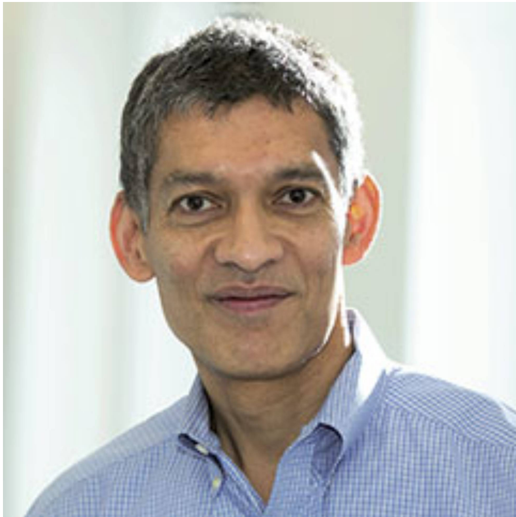
Eswar S. Prasad, autor de 'El futuro del dinero', ensayo publicado por La Esfera de los Libros.

"La época del dinero en efectivo está llegando a su fin y la de las monedas digitales de banco central ha comenzado. El dinero, la banca y las finanzas se hallan al borde de una transformación. El dinero físico está destinado a convertirse en una reliquia, consolidándose los sistemas de pago digitales como la norma en todo el mundo. La banca va a cambiar a medida que otras formas de intermediación ganen preponderancia. Buena parte de la población del mundo obtendrá acceso, al menos, a servicios financieros básicos que mejorarán sus vidas y su bienestar económico" , asegura Eswar S. Prasad.